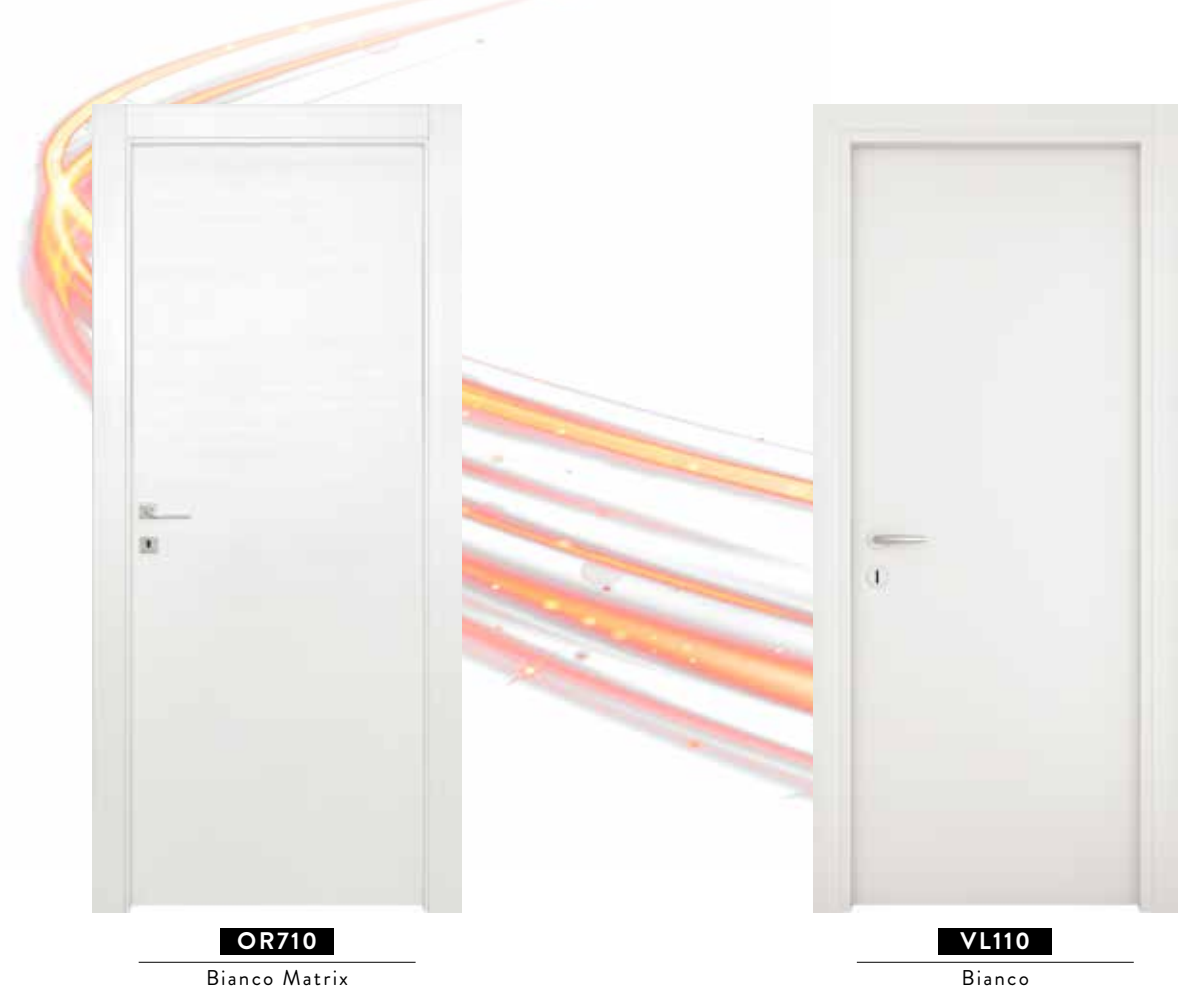
OR710 Bianco Matrix